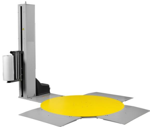
(Variante mit 3 Standard-Rampen)

Neue Generation halbautomatischer Palettenstretchmaschinen