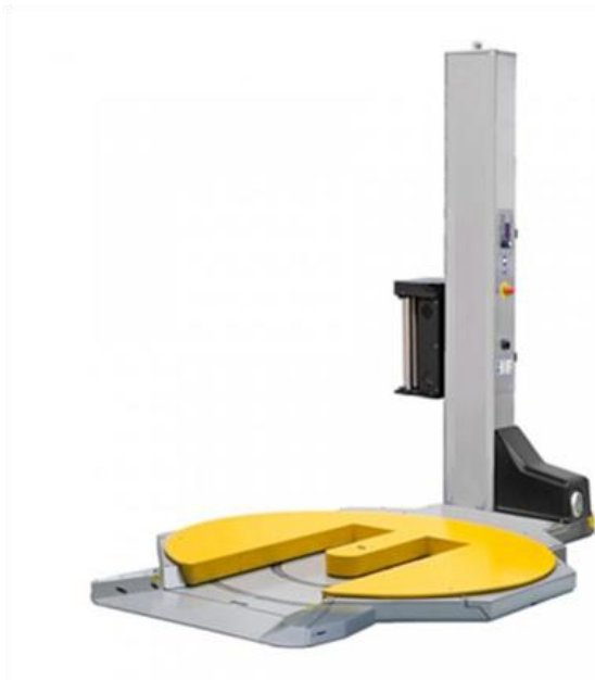
Variante Synthex TP mit ausgeschnittenem Drehteller, zum ebenerdigen Beschicken mit Hubwagen und Stapler)